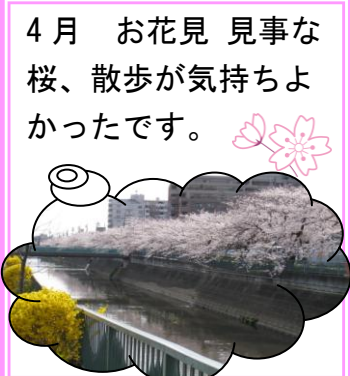
4月 お花見 見事な 桜、散歩が気持ちよ かったです。