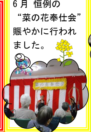
6月 恒例の “菜の花奉仕会” 賑やかに行われ ました。