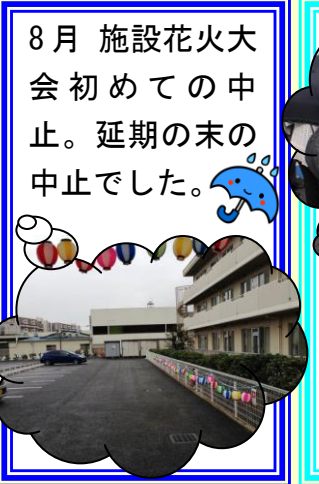
8月 施設花火大 会初めての申 止。延期の末の 中止でした。