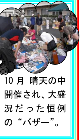
10月 晴天の中 開催され、大盛 況だった恒例 の“バザー”。