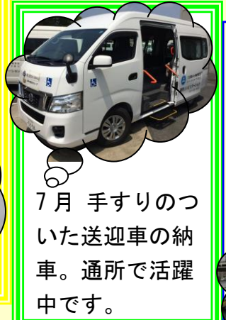
7月 手すりのつ いた送迎車の納 車。通所で活躍 中です。