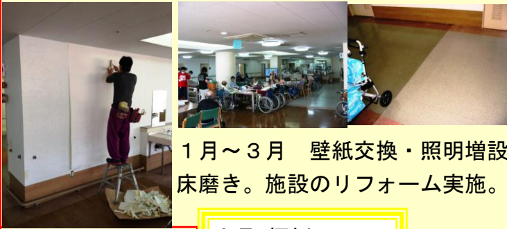
1月～3月 壁紙交換・照明増設 床磨き。施設のリフォーム実施。