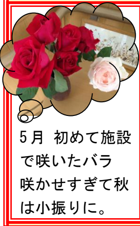
5月 初めて施設 で咲いたバラ 咲かせすぎて秋 は小振りに。