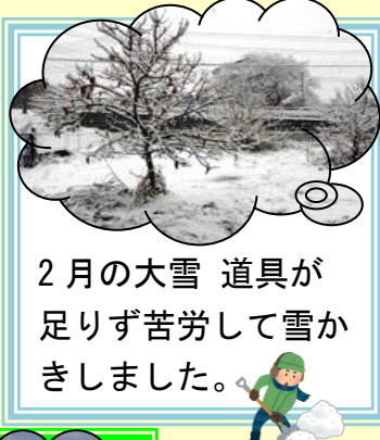
2月の大雪 道具が 足りず苦労して雪か きました。