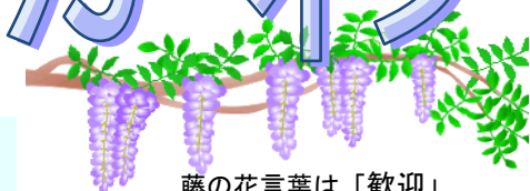
藤の花言葉は「歓迎」