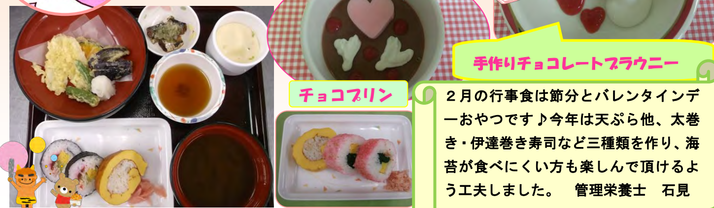
手作りチョコレートブラウニー